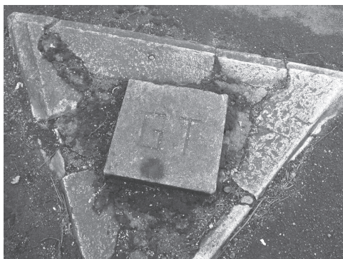
Slika 1: Gravimetrična točka osnovne gravimetrične mreže Jugoslavije.

Pomladi leta 2005 je Geodetska uprava R Slovenije pregledala točke osnovne gravimetrične mreže na terenu. Ugotovljeno je bilo, da je od skupno 31 točk osnovne gravimetrične mreže ohranjenih še 22 točk. Ostale točke (9) so uničene ali nedostopne.