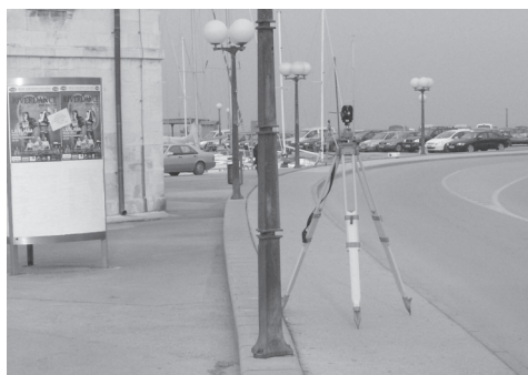
Slika 4: Stabilizacija in signalizacija referenčnih točk (levo) in ekscentričnih stojišč (desno).