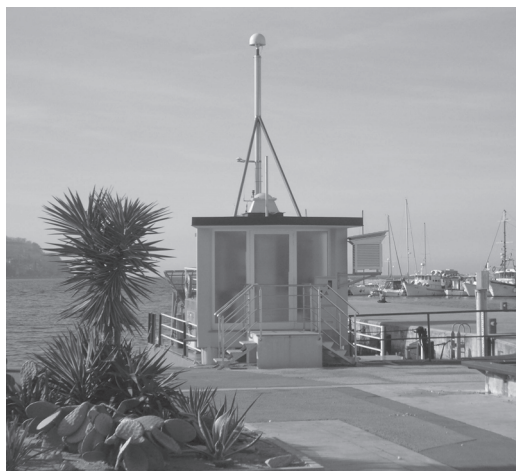
Slika 1: Stari mareograf iz leta 1958 (levo) in novi mareograf s permanentno postajo GPS (desno).

Omeniti je treba, da je pričujoči članek nadaljevanje članka Stopar et al., 2006 z namenom podrobnejše razlage predvsem poglavja 3.4.