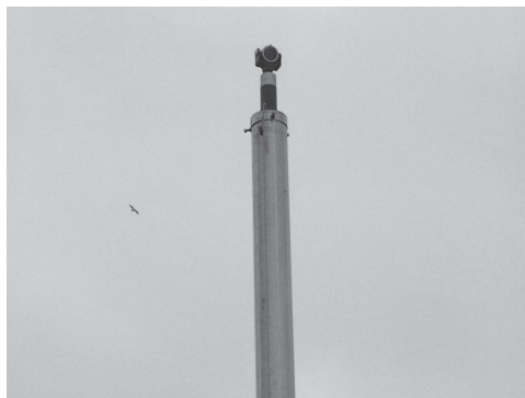
Slika 3: Kontrolna točka KOPE – antena GPS (levo) in reflektor (desno).