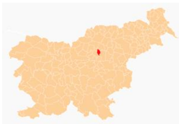
Slika 3: Prikaz lege Občine Polzela v Sloveniji (Občina Polzela, 2014)

Občina Polzela se razteza na severozahodu Spodnje Savinjske doline. Ustanovljena je bila leta 1998. Meri 34 m 2 in se po površini v slovenskih občinah uvršča na 163. mesto. Ima 6.118 prebivalcev, ki živijo v 8 naseljih: Andraž, Breg pri Polzeli, Dobrič, Ločica ob Savinji, Orova vas, Podvin pri Polzeli in Polzela.