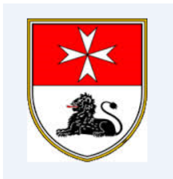
Slika 4: Grb Občine Polzela (Občina Polzela, 2014)

Grb nakazuje zgodovinsko obdobje malteškega viteškega reda, saj mu glavno oblikovno zasnovano daje križ kot simbol Maltežanov in izklesani antični lev iz pohorskega marmorja, ki stoji ob vhodu gradu Komenda. Lev predstavlja simbol viteštva, oblasti in moči. Upodobljen je na deljenem ščitu poznogotskega stila in je sanitske oblike.