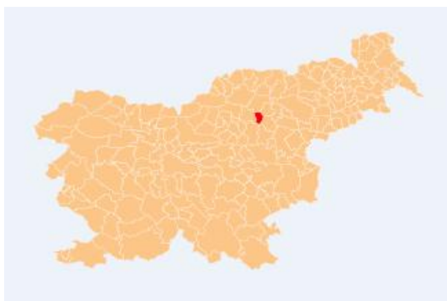
Slika 5: Prikaz lege Občine Dobrna v Sloveniji (Občina Dobrna, 2014)

Dobrna je pridobila status občine z reformo lokalne samouprave RS leta 1998. Je geografsko zaključena celota na severnem delu Celjske kotline, med zelenimi obronki Paškega Kozjaka in gozdovi Pohorja. Občina Dobrna je del savinjske statistične regije. Meri 32 km 2 . Po površini se med slovenskimi občinami uvršča na 172. mesto in ima 2.188 prebivalcev. V občini Dobrna je 11 naselij in sicer: Dobrna, Klanc, Zavrh nad Dobrno, Lokovina, Loka pri Dobrni, Parož, Pristova, Brdce nad Dobrno, Strmec nad Dobrno, Vinska Gorica in Vrba.