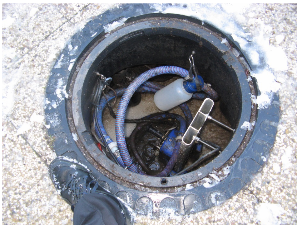
Slika 3: Merilno mesto iztok na MKČN na Lubniku.

Figure 3: Measuring outflow location at small wastewater treatment plant on Lubnik mountain.