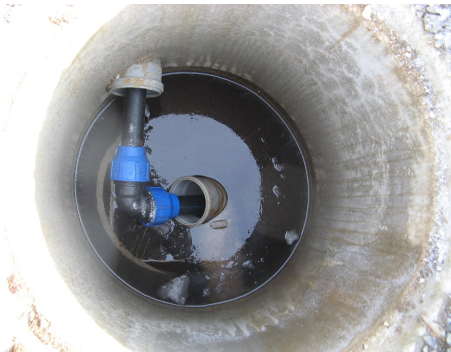
Slika 5: Merilno mesto iztok na MKČN na Ratitovcu.