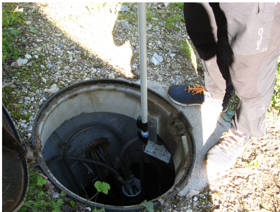
Slika 4: Vzorčenje na merilnem mestu iztok na MKČN na Gorjancih.

Figure 3: Measuring outflow location at small wastewater treatment plant on Lubnik mountain.