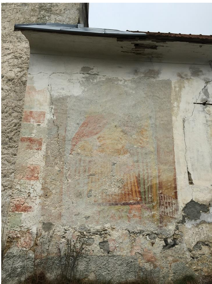
Slika 4: Freska sv. Krištofa na južni steni ladje