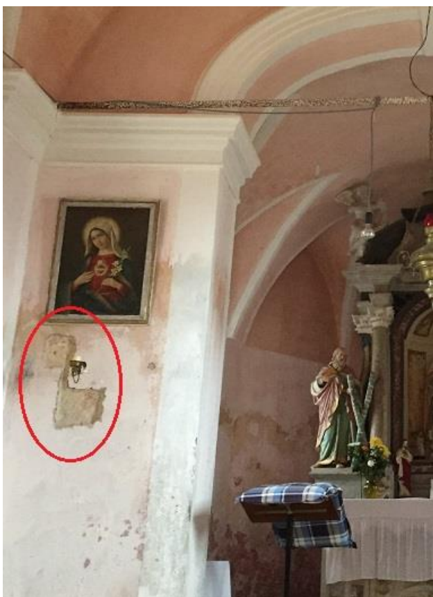
Slika 20: Posvetilni križ na slavoločni steni