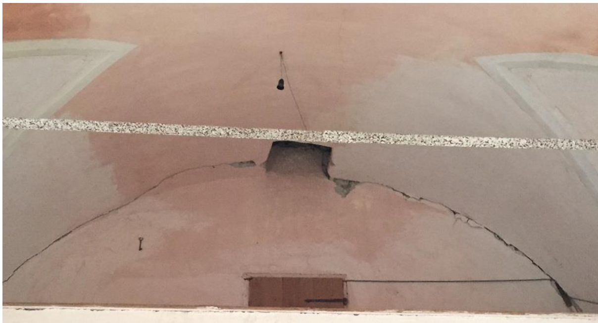
Slika 15: Stik zvonika z ladjo