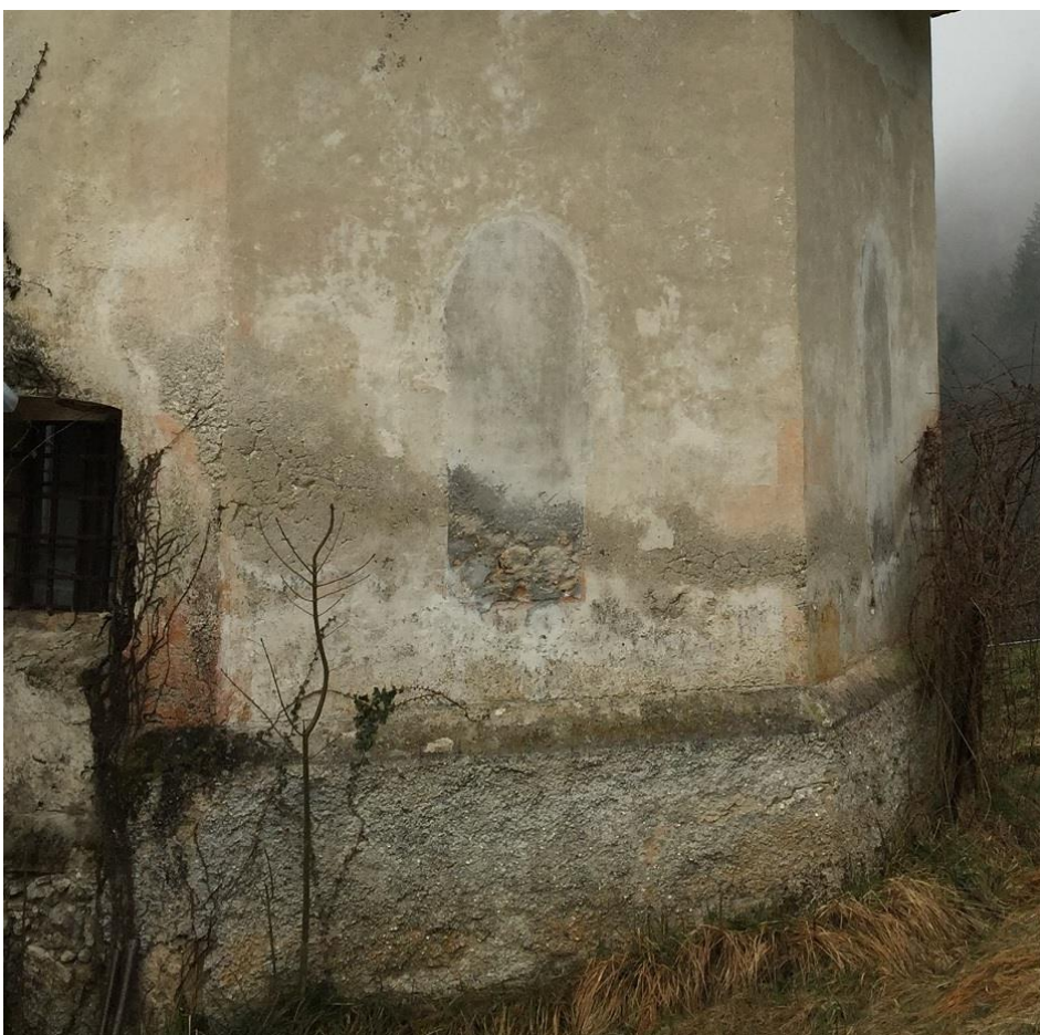
Slika 5: Zazidana gotška okna na prezbiteriju