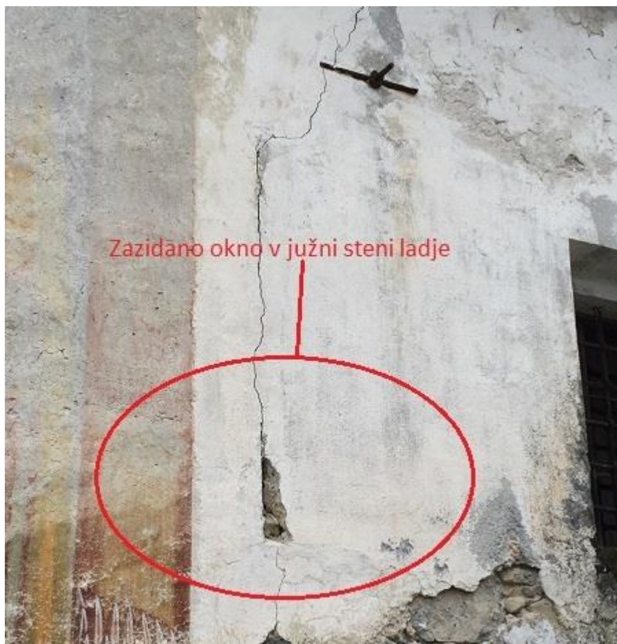
Slika 9: Zazidano okno v južni steni ladje