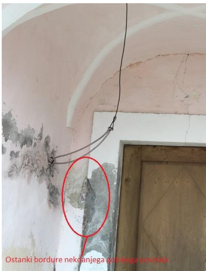
Slika 10: Ostanki bordure nekdanjega gotskega portala