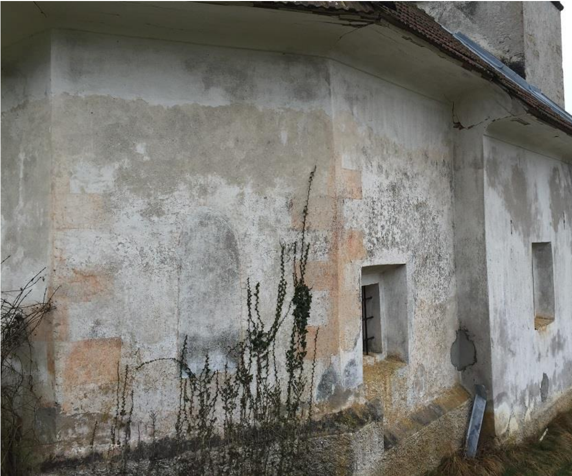
Slika 6: Oker šivan rob