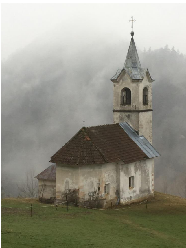
Slika 1: Pogled na cerkev s severne strani

V prezbitериjski ladji so na zunanjski strani vidna tri zazidana gotška okna. Pod napuščem so opazni rahli sledovi dekorativne poslikave v pasu in v okrasni brvi, ki poteka tudi okoli zazidanih oken.