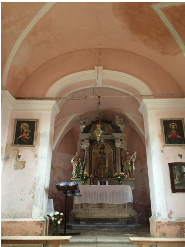
Slika 13: Pogled proti prezbitერიju