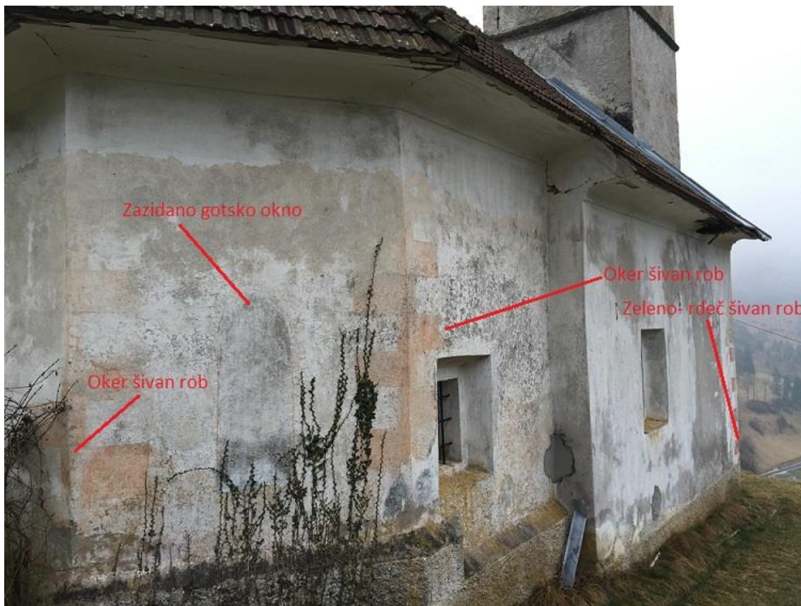
Slika 2: Severna fasada z označenimi varovanimi elementi

Lopa zvonika se odpira skozi vstopna vrata v ladjo in proti zahodu. Na začetku je polkrožen lok, znotraj pa je križno svoden. Barve so enake kot v cerkveni notranjščini. Tlak je iz cementnih ploščic.