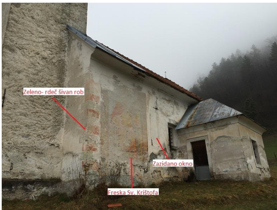
Slika 3: Južna fasada z označenimi varovanimi elementi