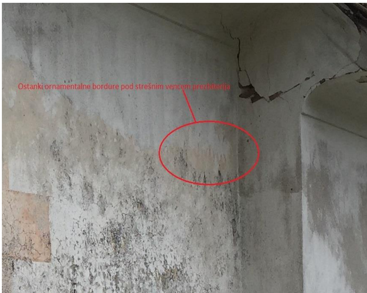
Slika 8: Ostanki ornamentalne bordure na severni steni prezbitorija