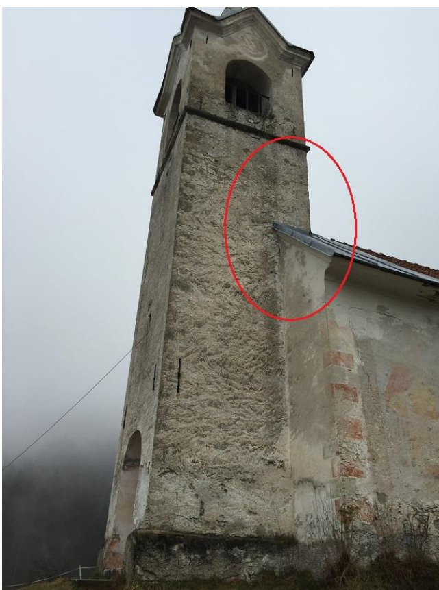
Slika 12: Zvonik se zajeda v ladjo cerkve