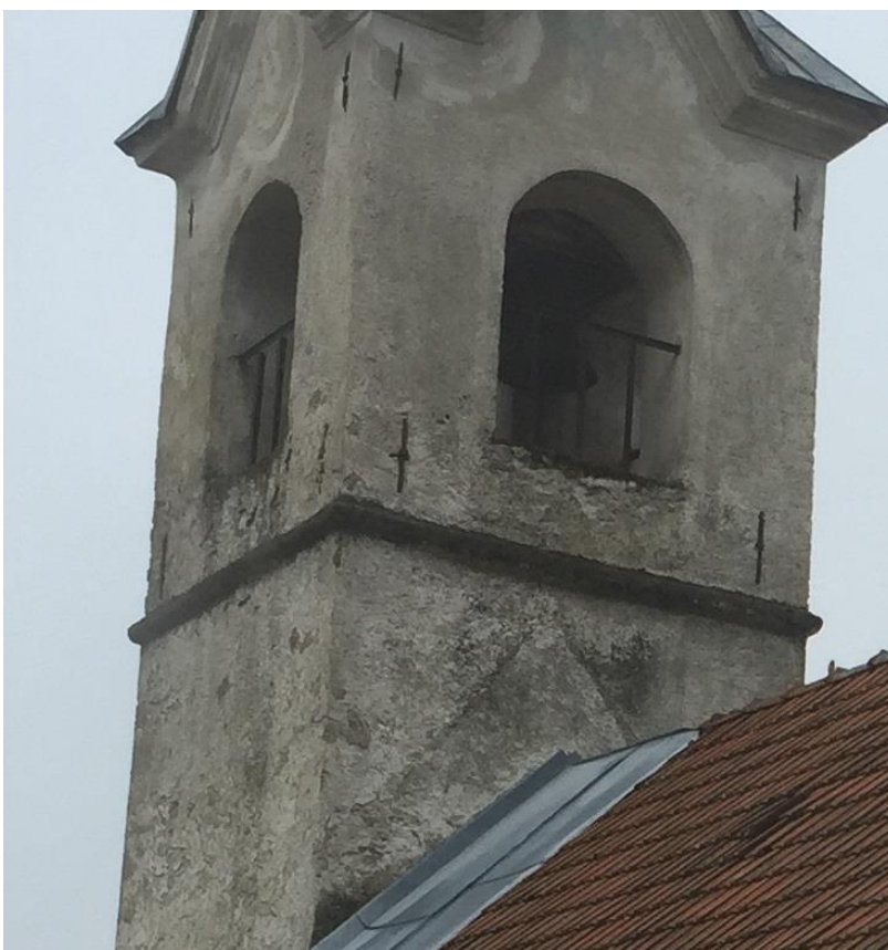
Slika 11: Sledi starejšega naklona strehe cerkve in viden zamik od osi zvonika