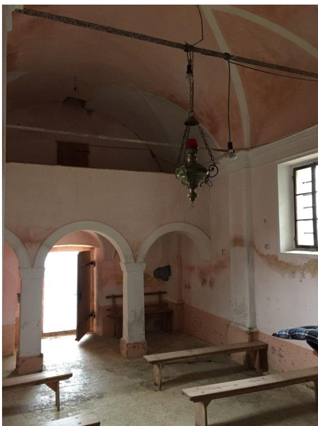
Slika 14: Pogled proti koru