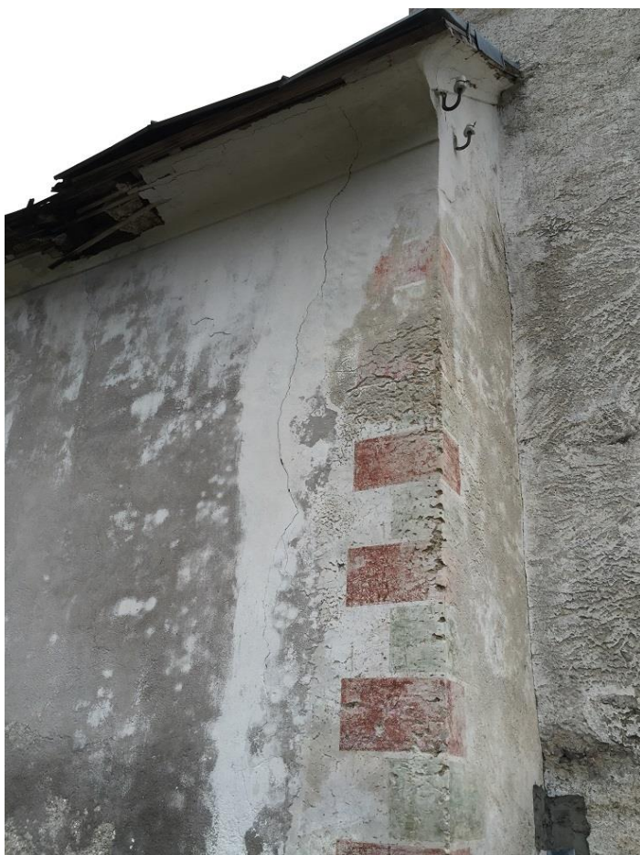
Slika 7: Zeleno-rdeč šivan rob na zahodnih vogalih ladje