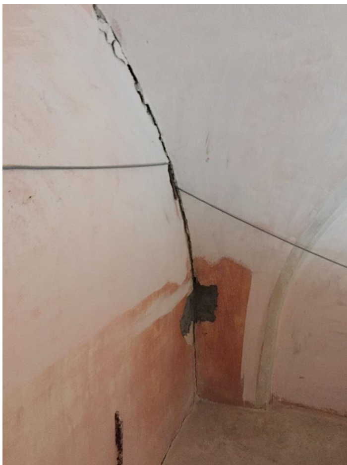
Slika 16: Stik zvonika z ladjo