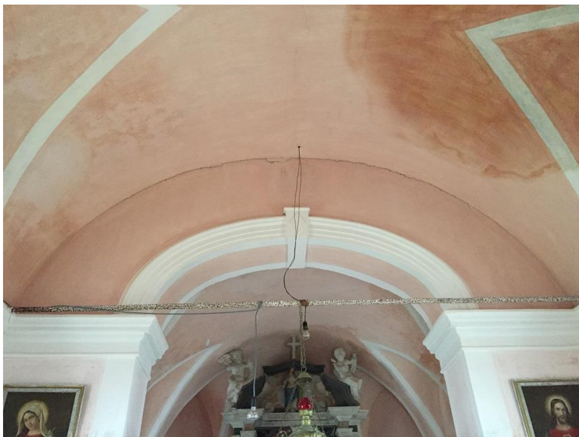
Slika 17: Stik slavoločne stene s stropom