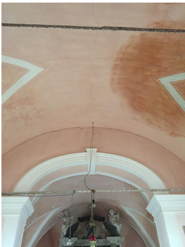
Slika 19: Strop ladje