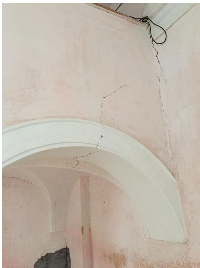
Slika 18: Stik kora s stenami ladje